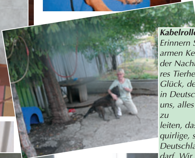
Kabelrolle als Hütte