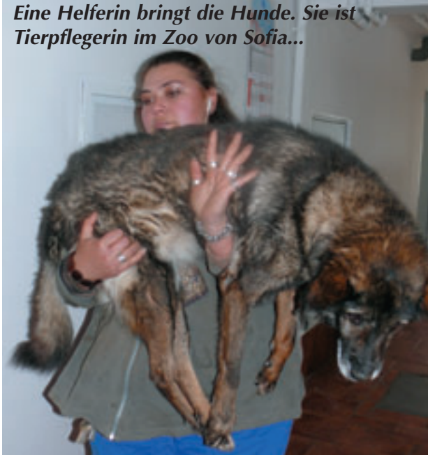
Eine Helferin bringt die Hunde. Sie ist Tierpflegerin im Zoo von Sofia...