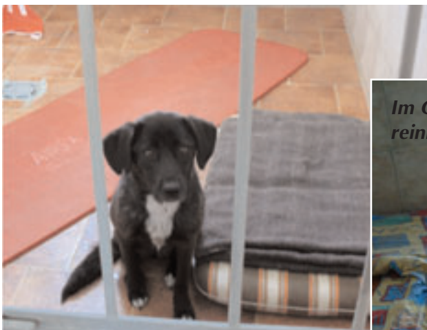
Im Gehege, wir können raus- und reinkommen...