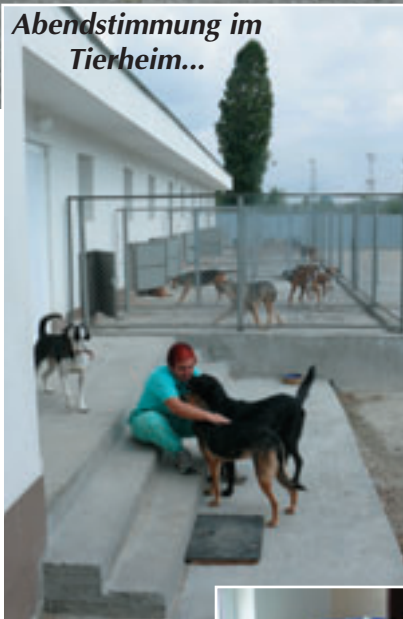
Abendstimmung im Tierheim...