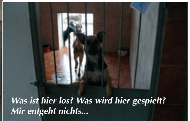
Was ist hier los? Was wird hier gespielt? Mir entgeht nichts...