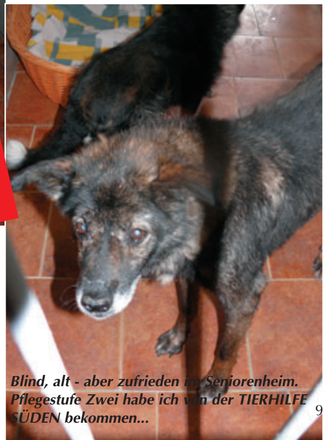
Blind, alt - aber zufrieden im Seniorenheim. Pflegestufe Zwei habe ich von der TIERHILFE SÜDEN bekommen...