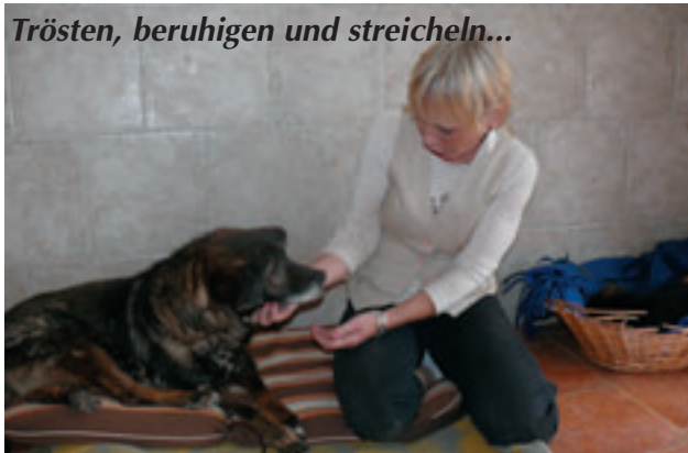
Trösten, beruhigen und streicheln...

Für uns geht eine schwere Zeit vorüber, wir haben so gekämpft für diese Tiere und ihr neues Heim.