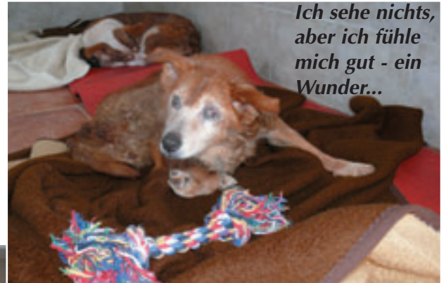
Ich sehe nichts, aber ich fühle mich gut - ein Wunder...