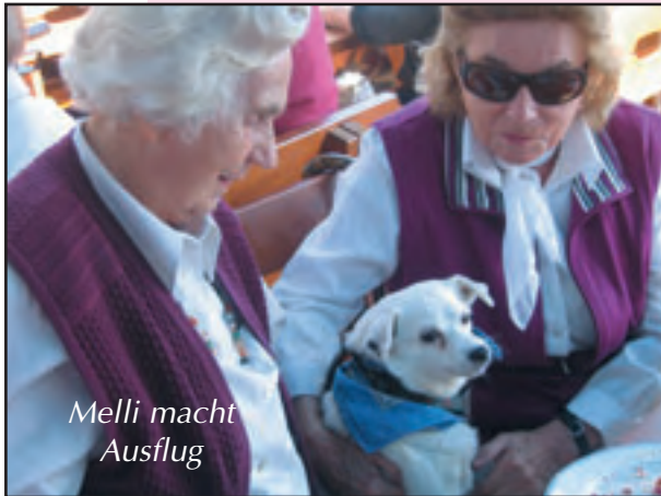
Melli macht Ausflug

Fotos können Sie sehen, wie uns beiden - Mensch und mir - das gut tut! Ach, beinahe hätte ich es vergessen: Ich bin ein kleiner rassistiger Hund, weiß, mit schwarzen Fleckchen am Ohr und Rücken, 7 Kilo leicht. Obwohl Marianne sagt, ich sei zu dick!