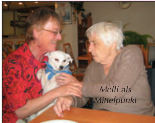
Melli als Mittelpunkt