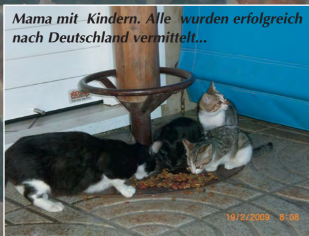
Mama mit Kindern. Alle wurden erfolgreich nach Deutschland vermittelt...