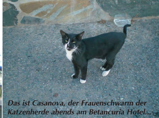
Das ist Casanova, der Frauenschwarm der Katzenherde abends am Betancuria Hotel...