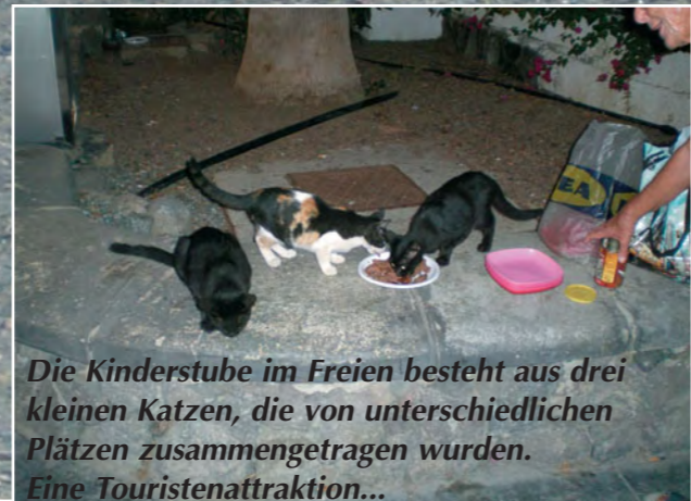
Die Kinderstube im Freien besteht aus drei kleinen Katzen, die von unterschiedlichen Plätzen zusammengetragen wurden. Eine Touristenattraktion...