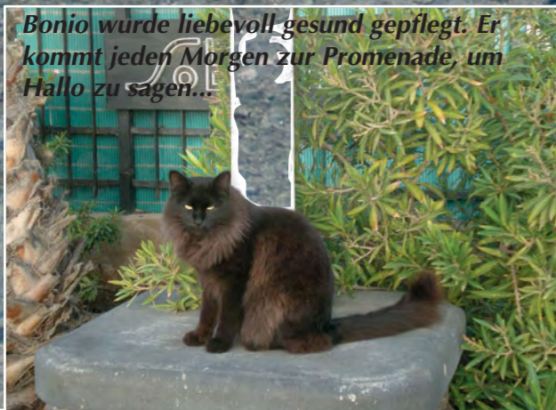
Bonio wurde liebevoll gesund gepflegt. Er kommt jeden Morgen zur Promenade, um Hallo zu sagen...