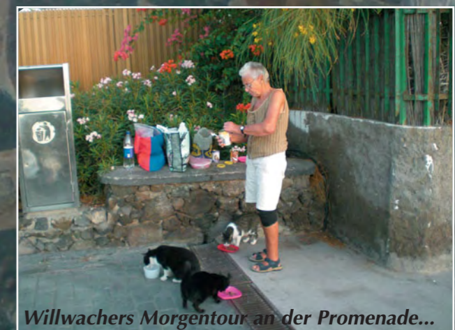
Willwachers Morgentour an der Promenade...