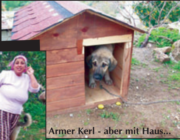
Armer Kerl - aber mit Haus...