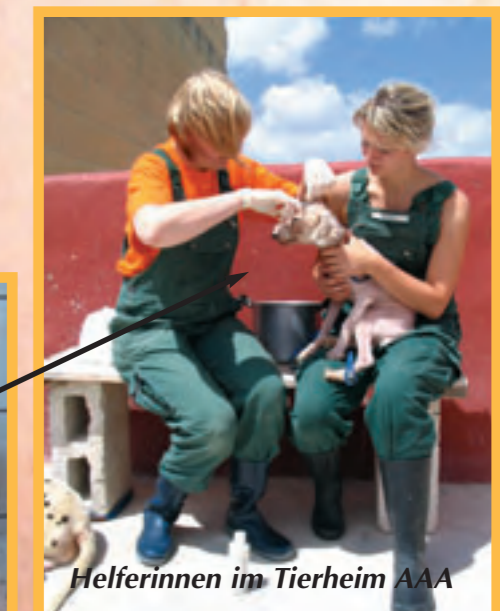
Helferinnen im Tierheim AAA