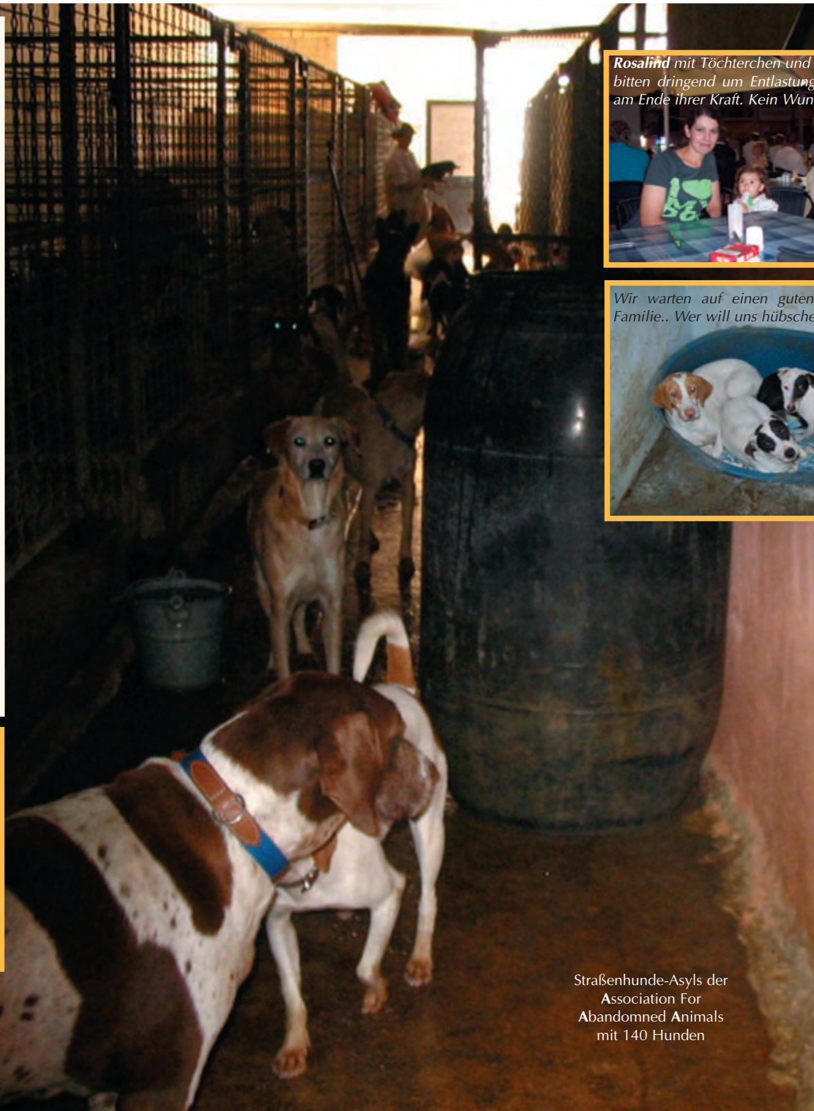
Straßenhund-Asyls der Association For Abandoned Animals mit 140 Hunden

Danksagung von Dr. Neumann: Für die Ermöglichung des Projekts möchte ich mich im Namen aller Beteiligten herzlich bei TIERHILFE SÜDEN e.V. bedanken und hoffe von ganzem Herzen auf eine Ausweitung der Unterstützung dieses Tierheims, da die gute Betreuung der Tiere gewährleistet bleiben sollte.