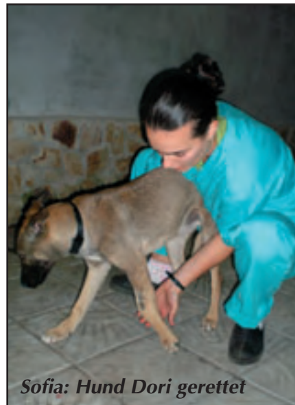
Sofia: Hund Dori gerettet