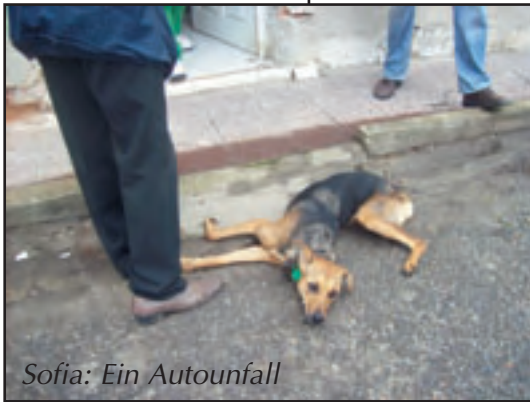
Sofia: Ein Autounfall