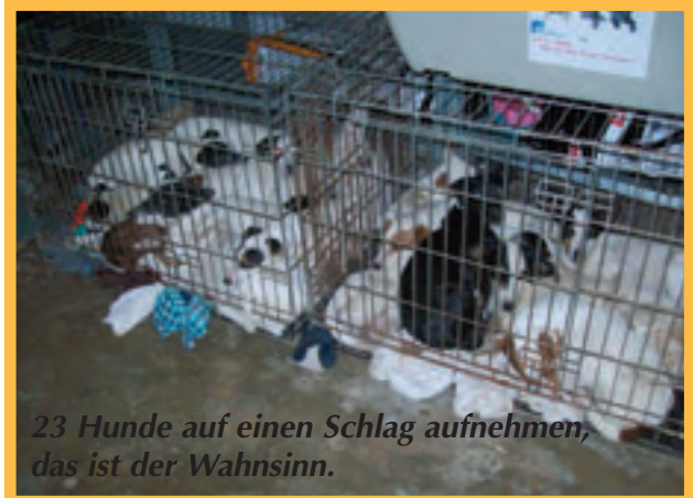
23 Hunde auf einen Schlag aufnehmen, das ist der Wahnsinn.