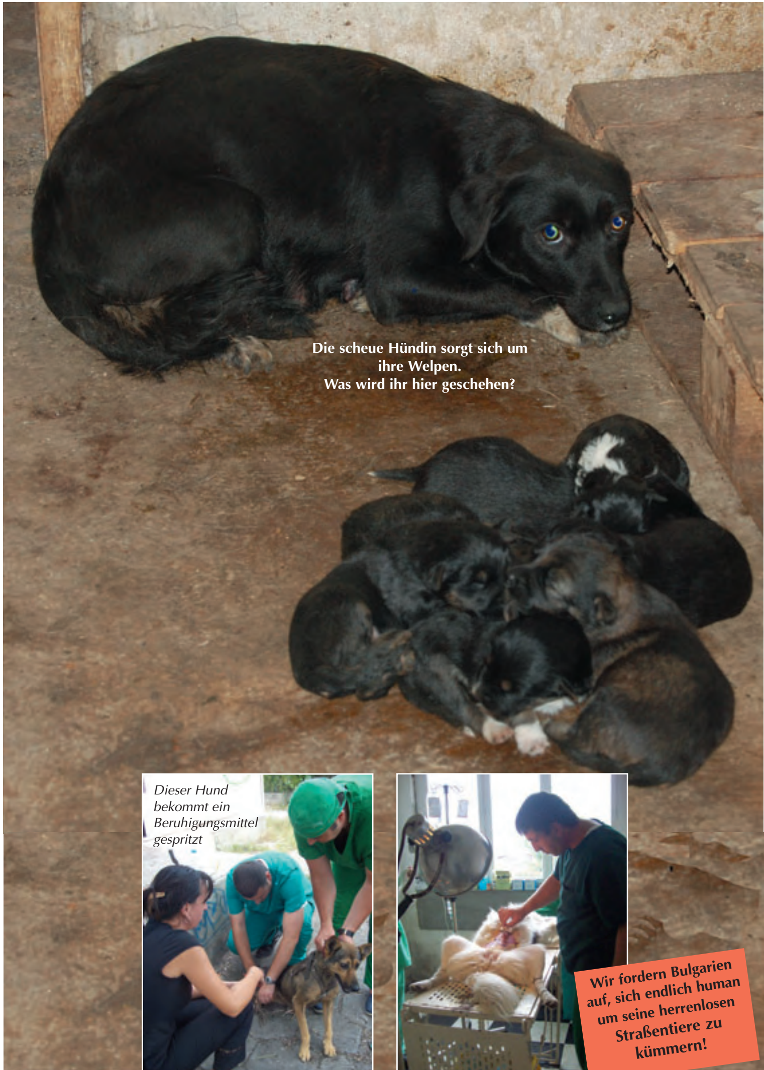
Die scheue Hündin sorgt sich um ihre Welpen. Was wird ihr hier geschehen?