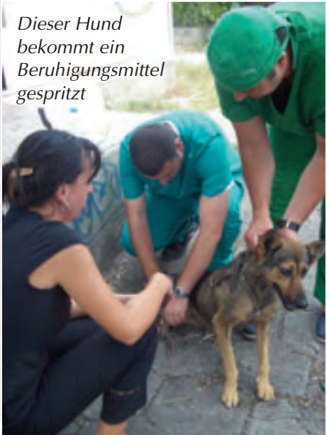
Dieser Hund bekommt ein Beruhigungsmittel gespritzt