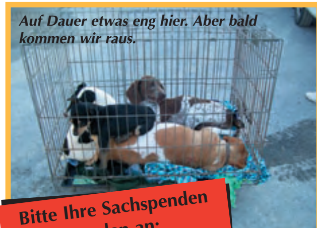
Auf Dauer etwas eng hier. Aber bald kommen wir raus.

Bitte Ihre Sachspenden senden an: ITG GmbH Internationale Spedition + Logistik - TIERHILFE S Ü D E N MALTA - Eichenstr. 2 85445 Schwaig bei München Tel. 0 8122 - 567-1173