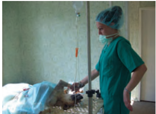
Warten, bis er eingeschlafen ist. Die Tierärztin überwacht seine Narkose liebevoll.