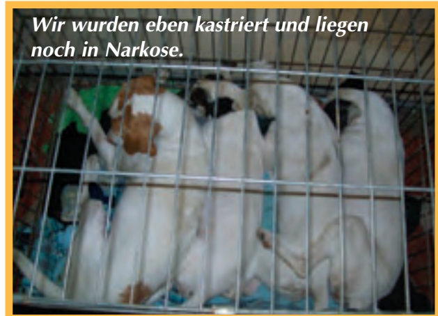
Wir wurden eben kastriert und liegen noch in Narkose.