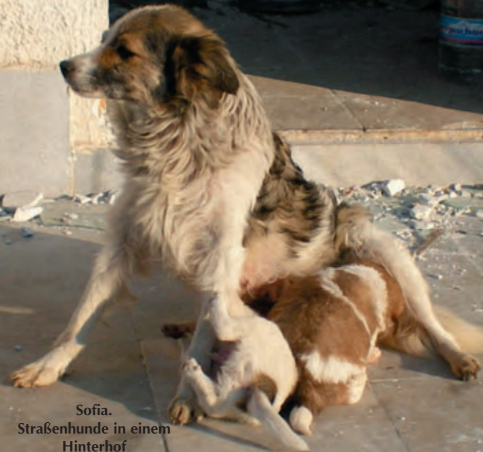
Sofia. Straßenhunde in einem Hinterhof

Alles Gute, kleine Bosna, es wird schon gut werden.