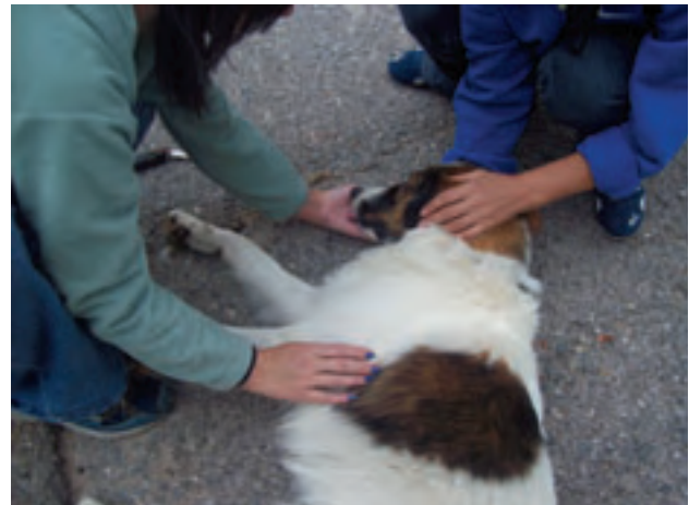
Menschen bringen Straßenhunde zum Kastrieren. Hier ist einer schon in Narkose, gleich gehts in den OP.