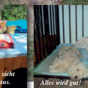
Alles wird gut!