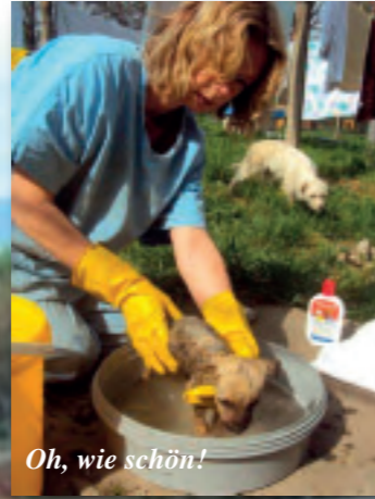
Oh, wie schön!

Fünf winzige Welpen wurden noch in einem Sack am Straßengraben gefunden. Auch sie hat Schoko liebevoll angenommen. Wenn sie die Kinder alle großgezogen hat, wird sie kastriert und darf im Sommer 2012 mit uns nach Österreich, sie hat sich den "goldenen Westen" verdient.