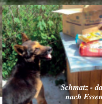
Schmatz - das sieht nach Essen aus.