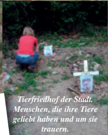
Tierfriedhof der Stadt. Menschen, die ihre Tiere geliebt haben und um sie trauern.