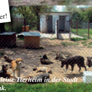
Unser kleine Tierheim in der Stadt Kazanlak.