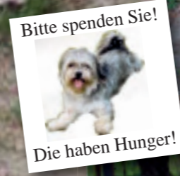
Die haben Hunger!