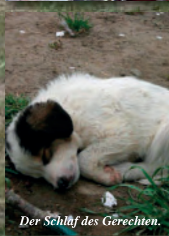
Der Schlaf des Gerechten.