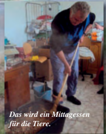
Das wird ein Mittagessen für die Tiere.