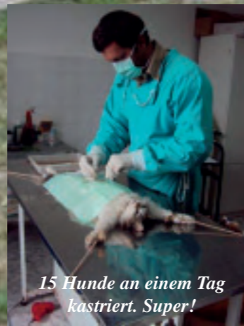
15 Hunde an einem Tag kastriert. Super!

Kastrationsprojekt vom 25.4. bis 1.5.2011 in Kooperation mit TIERHILFE SÜDEN e.V. DEUTSCHLAND und der ÖSTERREICHISCH-BULGARISCHEN HILFE FÜR TIERE e.V.