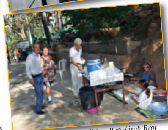
Vor dem Tor wurde traditionell türkisch Brot gebacken.