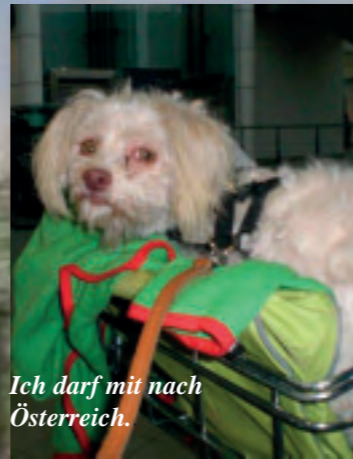
Ich darf mit nach Österreich.