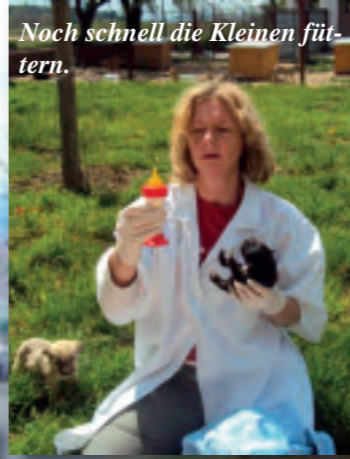
Noch schnell die Kleinen füttern.