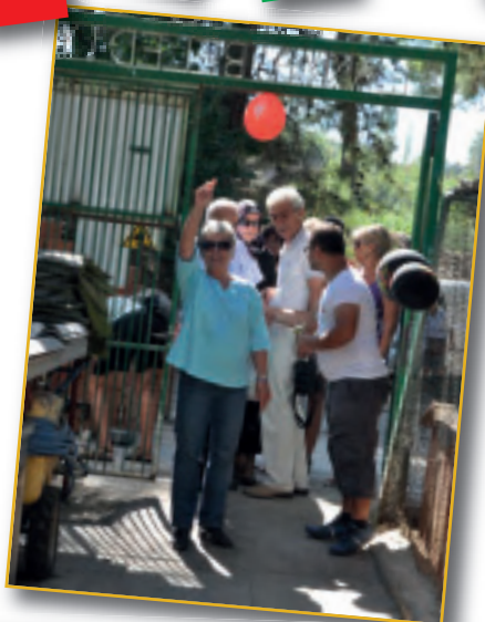
„Hei, Leute, hier spielt die Musik...“