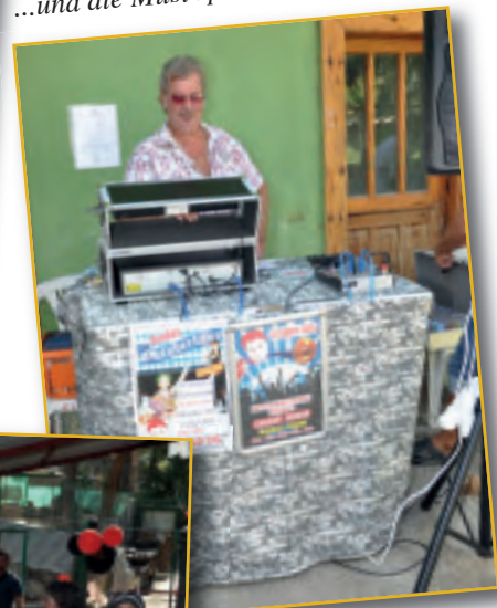
...und die Musi spielt dazu...