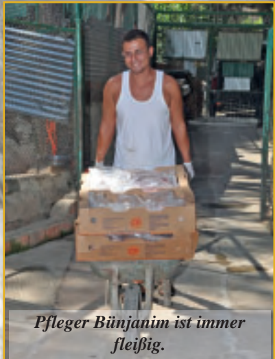
Pfleger Bünjanım ist immer fleißig.