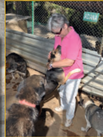
Hund Emma hat ein deutsches Ehepaar für sich gewonnen. Eine gute Sache.