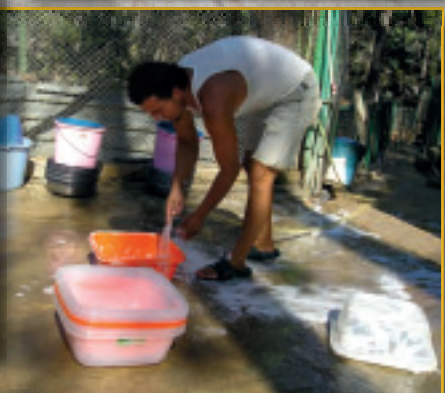
Sauberkeit für die Hunde. Futternäpfcchen werden gesäubert.