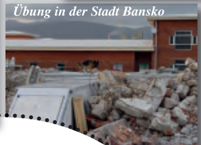
Übung in der Stadt Bansko

Ja, ich richte eine Spenden für einen Rettungshund ein. Mit monatlich 15 Euro ist das Futter für einen Monat gesichert.