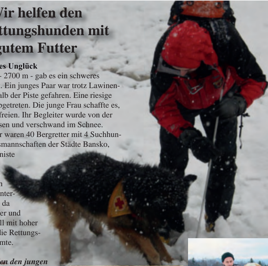
Hundeführer Zeus mit Hund Blago