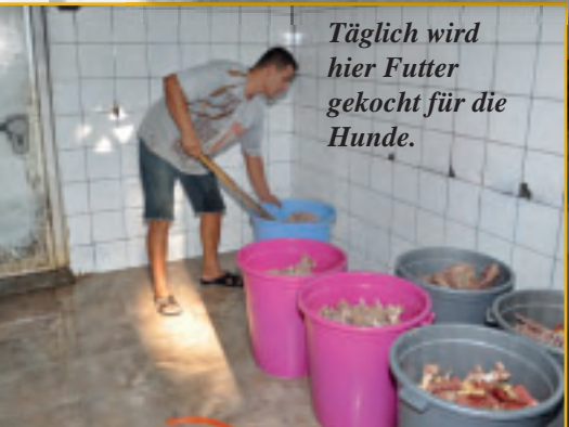
Täglich wird hier Futter gekocht für die Hunde.