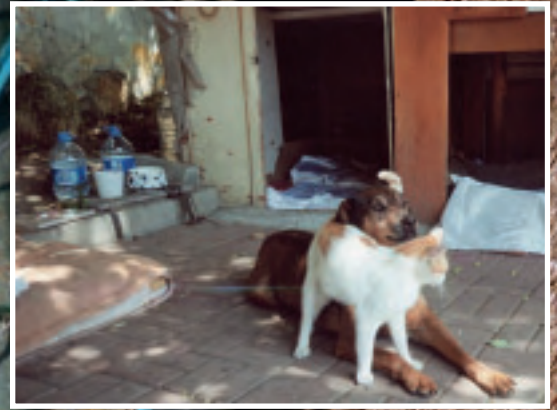
Kranker Hund Bubi im bewachten Otopark (Parkplatz). Abends kommen viele Katzen zum Übernachten. Man teilt sich Bett und Frühstück.