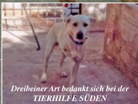
Dreibeiner Art bedankt sich bei der TIERHILFE SÜDEN