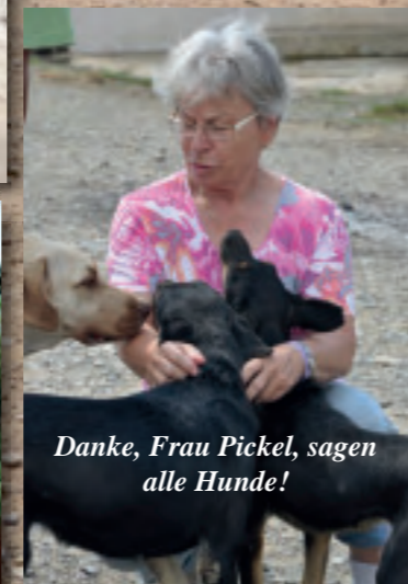
Danke, Frau Pickel, sagen alle Hunde!