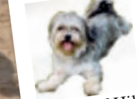
warten auf Hilfe!