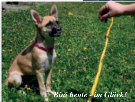
Bini heute - im Glück!