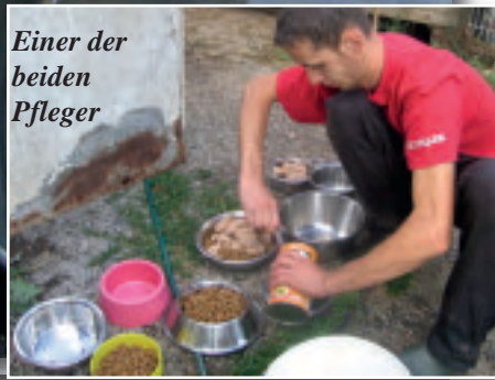
Einer der beiden Pfleger

Das Leben der Tiere in Bosnien ist ein ständiger Kampf ums Überleben. An jeder Ecke pures Elend. Das Tierheim in Sarajevo ist mit 300 Hunden und 50 Katzen übervoll.