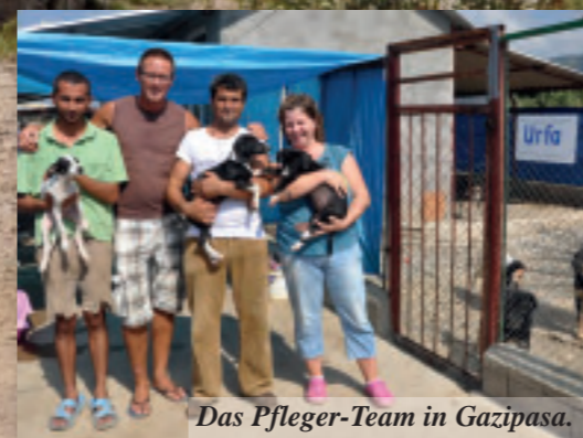
Das Pfleger-Team in Gazipasa.