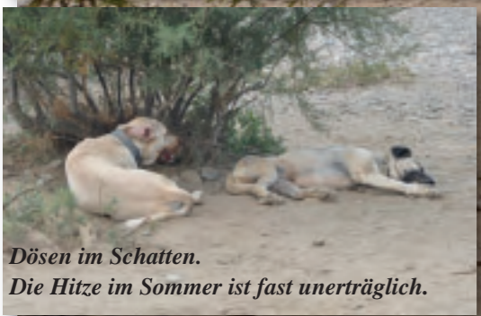
Dösen im Schatten. Die Hitze im Sommer ist fast unerträglich.