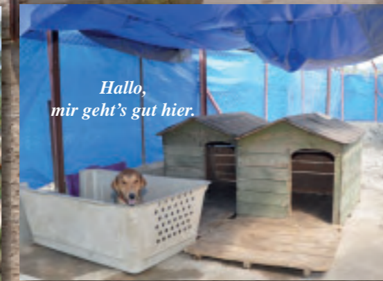
Hallo, mir geht's gut hier.