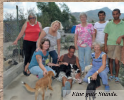
Eine gute Stunde.