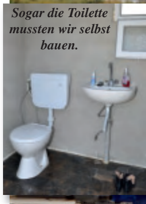
Sogar die Toilette mussten wir selbst bauen.

Bitte protestieren Sie mit unserer Postkarte gegen diese Gnadenlosigkeit der Stadt, auf Seite 28.