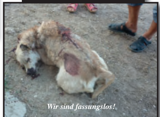
Wir sind fassungslos!

„Sitz“ - rief der Hundemörder. Der Hund machte sitz. Ein Schuß frontal in seine Kehle. Eine feige, hinterlistige Tat! Der Todesschütze wird sicherlich nur wegen unerlaubten Waffenbesitzes belangt werden.