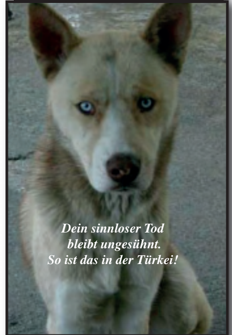
Dein sinnloser Tod bleibt ungesühnt. So ist das in der Türkei!