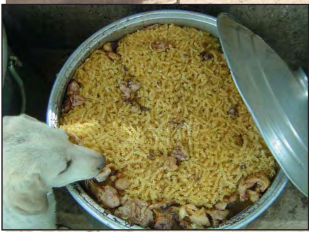
Futter mit Bulgur gestreckt. Das ist eine feine türkische Weizengrütze...