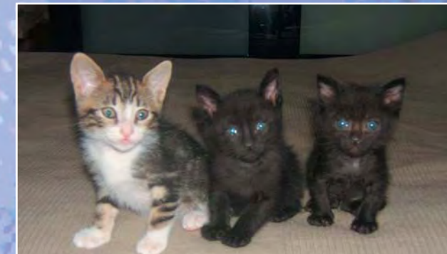
Babys gefunden, Mutter leider vergiftet...