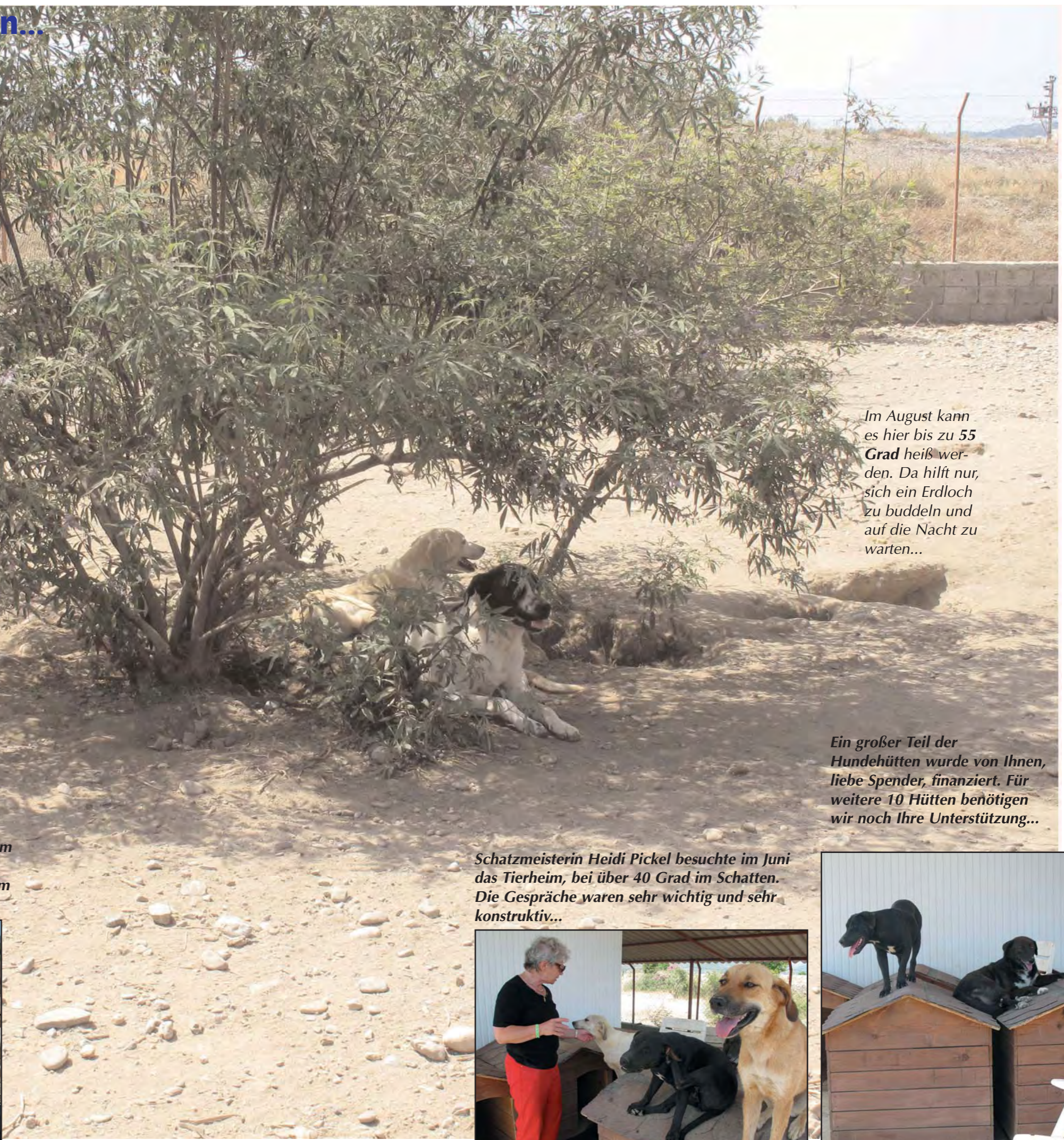
Im August kann es hier bis zu 55 Grad heiß werden. Da hilft nur, sich ein Erdloch zu buddeln und auf die Nacht zu warten...