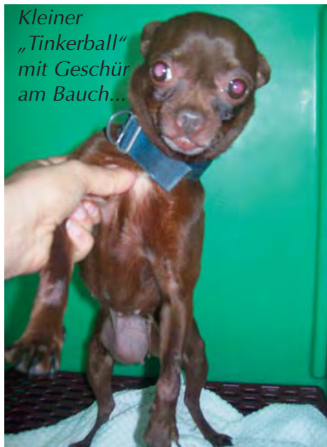
Kleiner „Tinkerball“ mit Geschwür am Bauch...