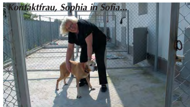
Die Hunde fühlen sich wohl hier...