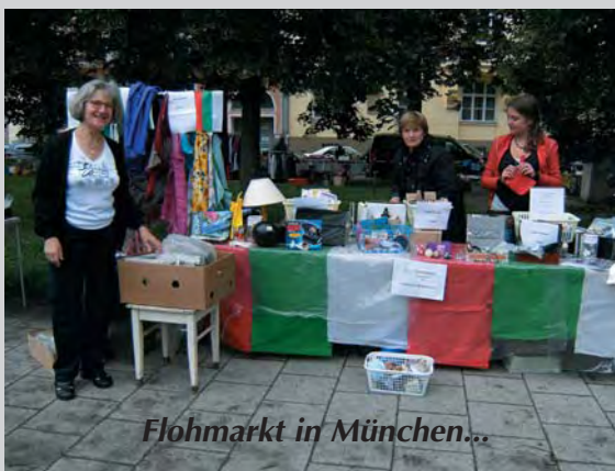
Flohmarkt in München...

der jetzige, sehr beliebte Bürgermeister, General Bojko Borissov die Wahl zum Ministerpräsidenten dieses Landes mit seiner konservativen GERB-Partei gewonnen hat. Bojko Borissov hat der TIERHILFE SÜDEN kostenlos das Grundstück für das Tierheim „Zweite Chance“ zur Verfügung gestellt. Auch ein guter Tag für die herrenlosen Hunde auf der Straße. Er liebt Hunde. Wir gratulieren und freuen uns mit ihm.