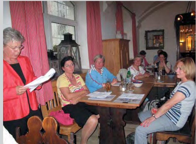
Es gibt viel zu erklären und zu erzählen, die Schatzmeisterin war sehr gefragt an diesem Abend. Sie macht ihre Arbeit hervorragend...