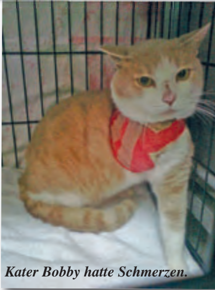
Kater Bobby hatte Schmerzen.

Katze Betty hatte einen Autounfall, wurde Gott sei Dank aufgelesen und hat sich aber schnell wieder erholt.