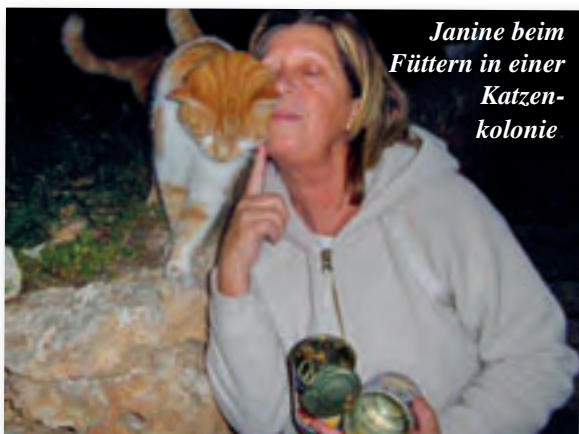
Janine beim Füttern in einer Katzenkolonie

Kätzchen Hope wurde durch Zufall mit gebrochenem Beinchen gefunden. Sie hatte sich schon mit Schmerzen verkrochen. Alle hier gezeigten Katzen haben ein neues Zuhause.