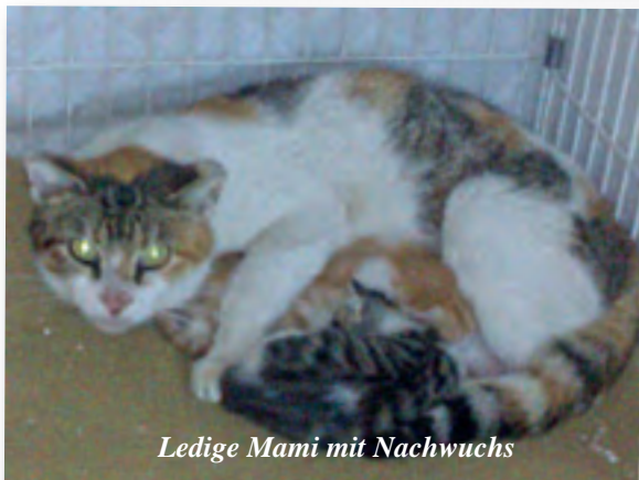
Ledige Mami mit Nachwuchs

Schwarzer Kater Sambesi hatte offensichtlich eine alte Wunde am Schwanz, die regelrecht abgefault war. So musste ihm ein Teil seines Schwanzes amputiert werden. Gott sei Dank wurde er gefunden, er wäre elend krepirt.