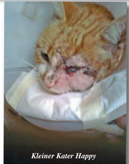
Kleiner Kater Happy