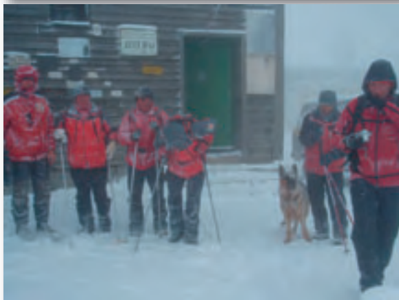
Der Winter war heuer sehr kalt und lang, mit vielen Schneestürmen, bis hinein in den März. Hier starten wir zu einer Übung ins Vituscha-Gebirge.

Wir haben eine neue Idee: Viele Jahre haben Sie die Rettungshunde mit Ihren Futterspenden begleitet. Nun sind viele dieser Hund alt geworden und wir denken, sie verdienen es, dass wir sie in ihren Lebensabend begleiten. Mit ärztlicher Fürsorge und was ein Tier so braucht, wenn es alt und krank wird, wie wir Menschen auch.