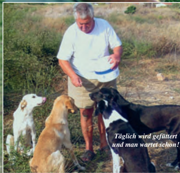
Täglich wird gefüttert und man wartet schon!