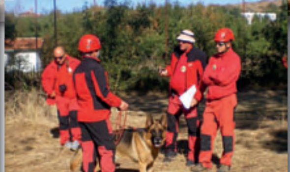
Kurs in Burgas vom 17. - 21. Sept. rundete das Programm ab. Wir sind zufrieden mit der Arbeit.