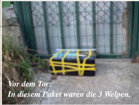
Vor dem Tor: In diesem Paket waren die 3 Welpen.

Im Winter spenden wir Futter für arme Bürger, damit sie ihre Streuner füttern können.