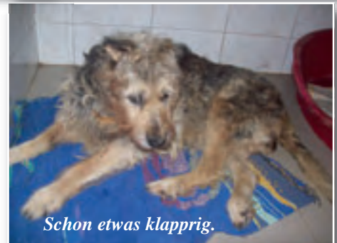
Schon etwas klapprig.

Auch in unserem Tier- heim „Zweite Chance“ ist alles voll mit alten und kranken Streunern.