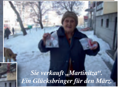
Sie verkauft „Martinitza“. Ein Glücksbringer für den März.

Im Winter spenden wir Futter für arme Bürger, damit sie ihre Streuner füttern können.