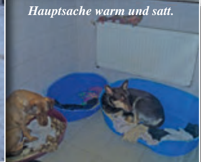
Hauptsache warm und satt.